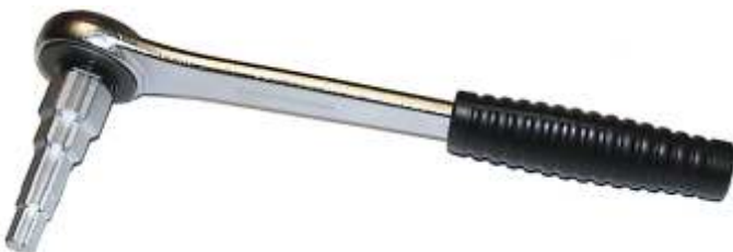
Art. 00810.0 Chiave per codoli di valvole da 3/8"-1/2"-3/4"-1". Cricchetto con attacco da 1/2". Steps wrench for valve nipples 3/8"-1/2"-3/4"-1" with ratchet 1/2".