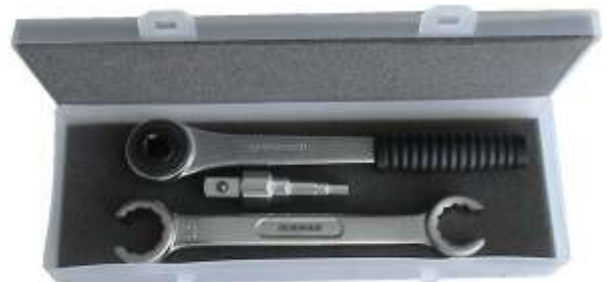
00810.K1 Kit chiave per codoli+ chiave aperta per dadi 24-27mm Kit Step wrench+Ratchet+Open Key 24-27mm