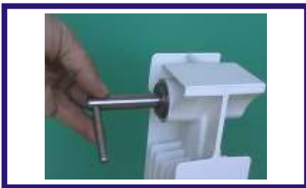
1: Inserimento della fresa di pulizia della filettatura nel mozzo del radiatore.