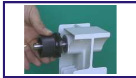
2: Pulizia e spiantatura della flangia di accoppiamento del radiatore.